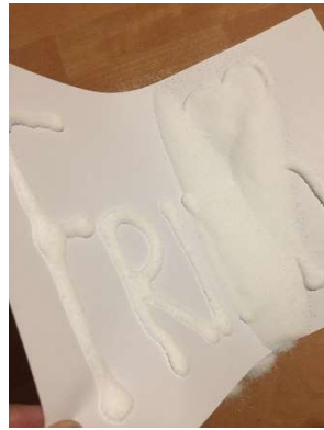
Das überschüssige Salz vorsichtig abschütteln und gut trocknen lassen (Das Salz kann aufbewahrt und für das nächste Bild genutzt werden)