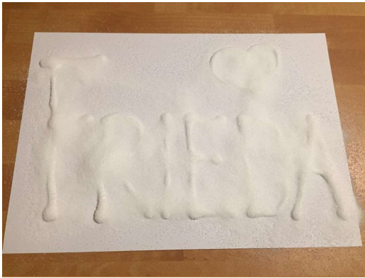
Das gesamte Motiv sollte großzügig mit Salz bedeckt sein