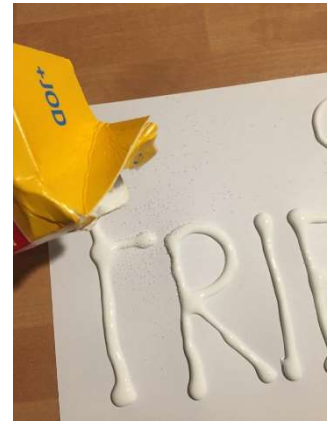
Salz über das Motiv schütten