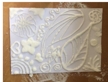
Wenn die Farbe getrocknet ist, sollte man das Bild in einen Bilderrahmen bringen (ein bisschen Salz bröseln immer noch ab...)