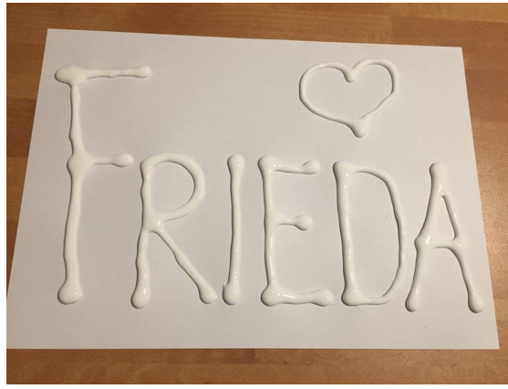
Nicht eintrocknen lassen!