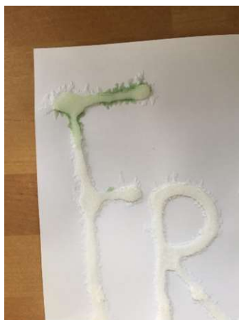
Man kann auch Tuschfarbe nehmen