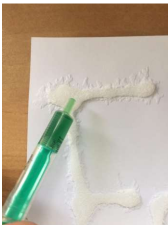
Farbe auftragen, ich nutze gern die restliche Ostereierfarbe und trage mit Spritze auf